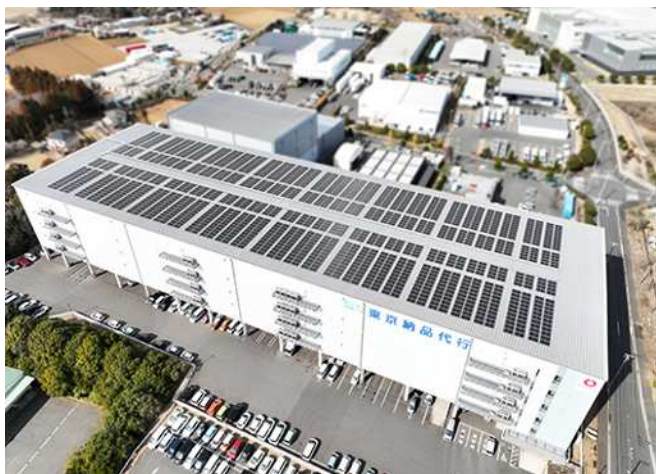
【東京納品代行 成田 FLC I 外観】