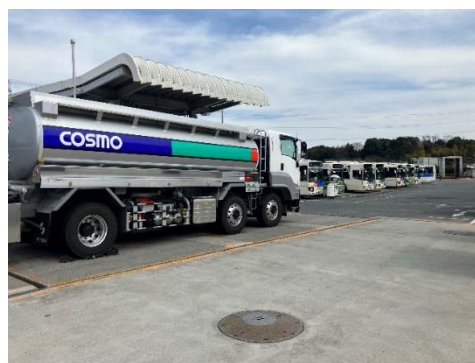
「コスモ CF-5 使用車両」