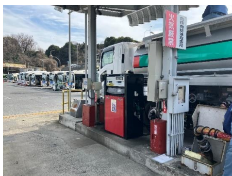
「相鉄バス株式会社 旭営業所での納入の様子」